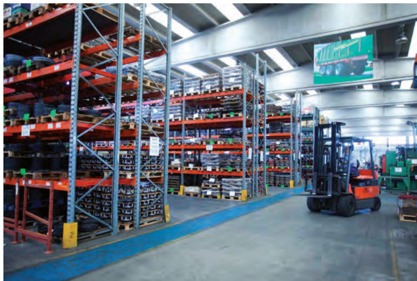
► L'"uragano" Covid-19 ha anche avuto dei risvolti positivi, quali la collaborazione e il senso di appartenenza tra la Direzione e i lavoratori