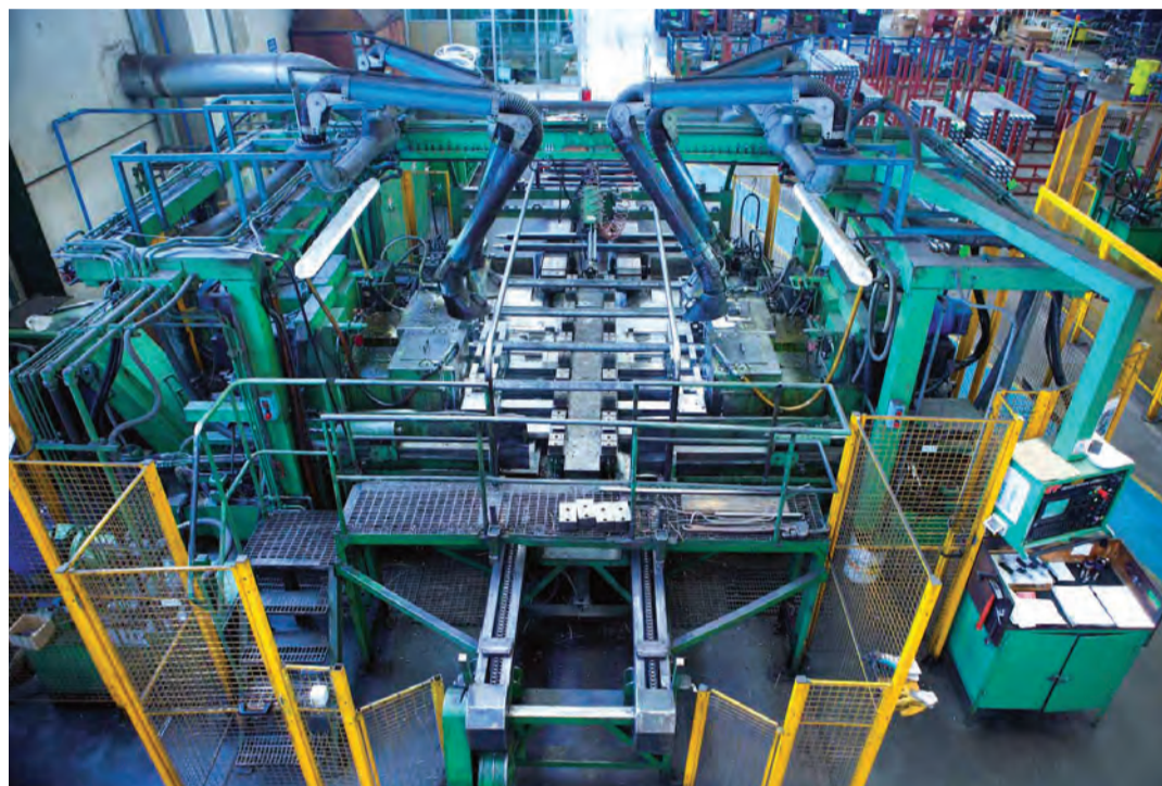
► Completamente italiani sono anche il design e l'Engineering di prodotto, sviluppati da FV Engineering, società del gruppo con sede in Lombardia, a cui è delegata tutta l'attività di ricerca e sviluppo che ha all'attivo diversi brevetti internazionali